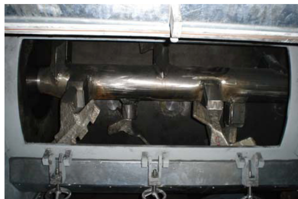
典型阳极品质及运行数据:

自设备成功启动以来，阳极糊料生产线正以连续方式运行着。第一个月已生产出 6000 块合格的阳极，体现了整体系统 100%的适应性。由于整个电解厂对阳极的需要量还不高，至今仍不要求阳极生产设备满负荷生产。我们正等待合适的时间进行全面的性能测试。目前的所得到阳极质量的数据已经达到了国际质量标准。